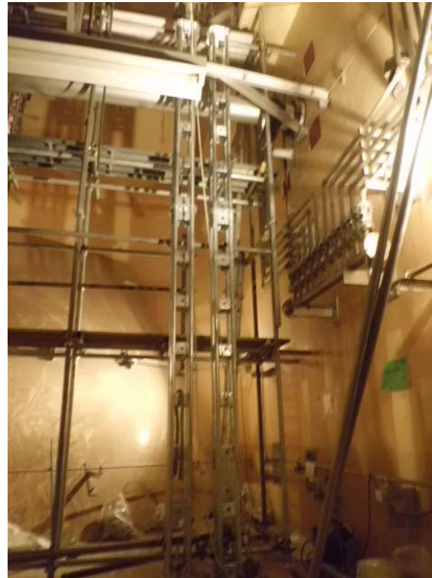
鋼製支柱設置状況